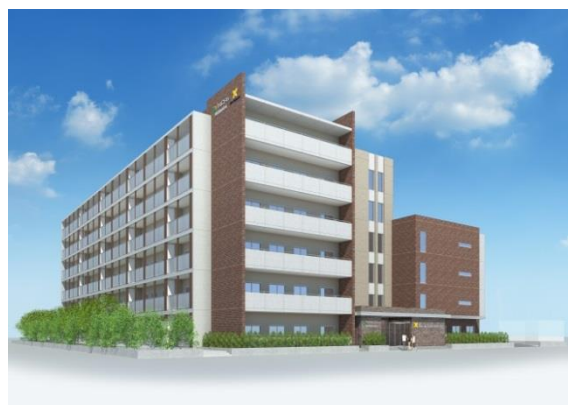
日吉国際学生寮完成予想図