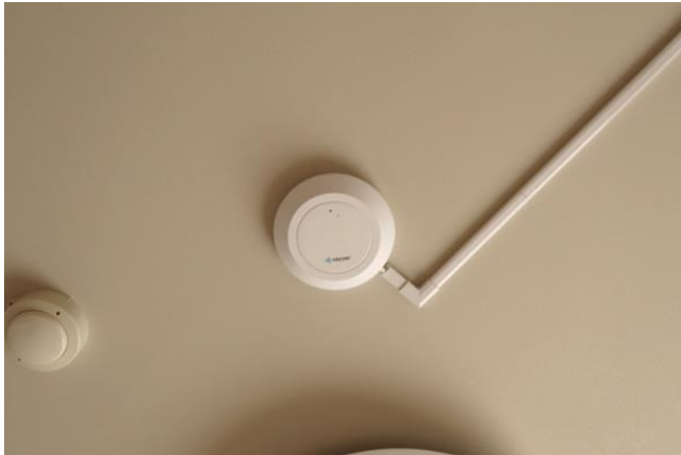
(図) 介護施設での実証のため天井に設置した転倒検知センサー