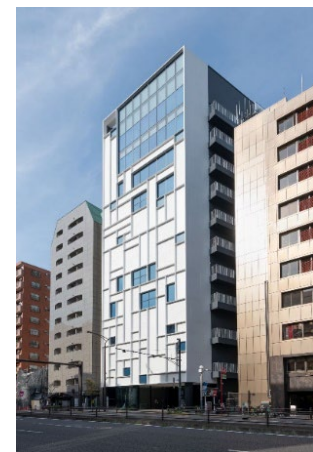
慶應義塾ミュージアム・コモンズ (三田キャンパス東別館) 外観