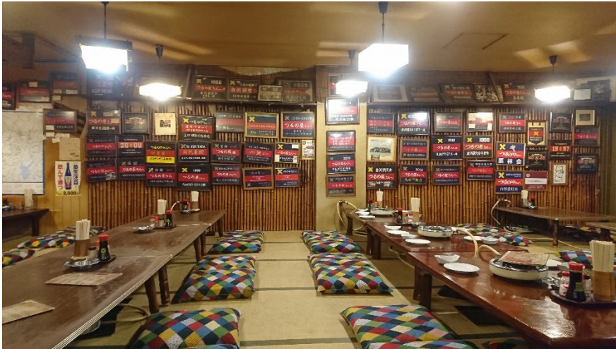
・「大衆割烹つるの屋」店内写真（2019年）