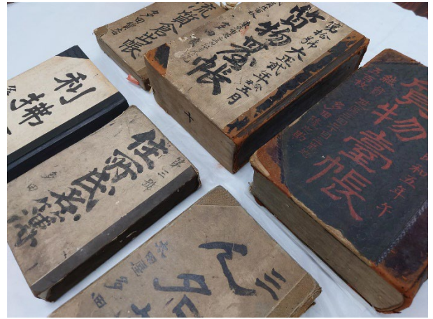
・多田質店質物台帳（慶應義塾福澤研究センター蔵）