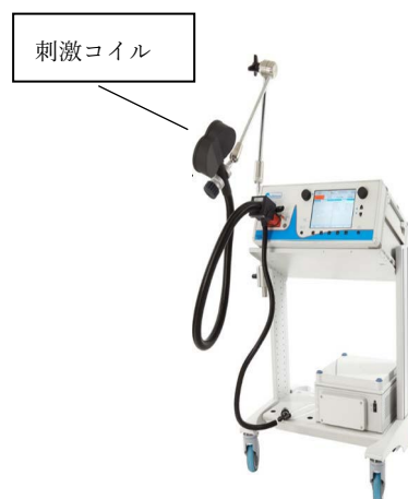
使用する磁気刺激装置