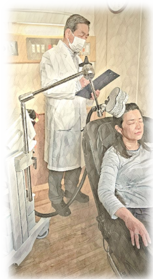
※画像はイメージです。 実際とは異なる場合があります。