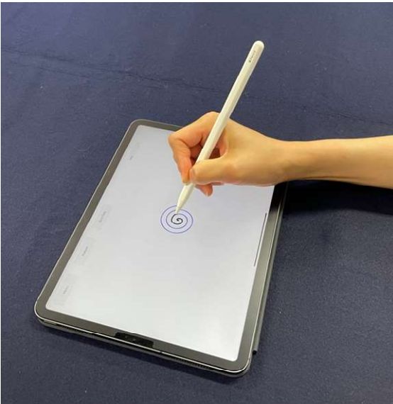
図 1. 計測方法

タブレット端末の画面上に表示される簡単な図形をスタイラスペンでなぞります。なぞっている間に筆跡と筆圧を経時的に測定します。