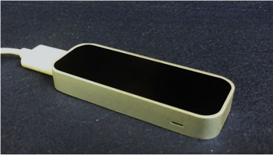
図1 Leap Motion

Ultraleap社の開発した小型センサーです。赤外線を用いて、手指の位置や動きをリアルタイムで抽出、表示することが可能です。