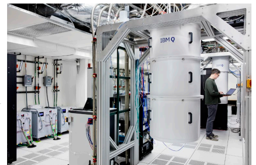
IBM Quantum Computer