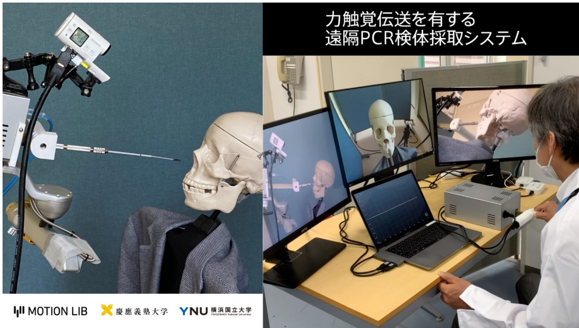
力触覚伝送を有する 遠隔PCR検体採取システム