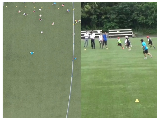
撮影映像(左：ドローン・右：固定カメラ)