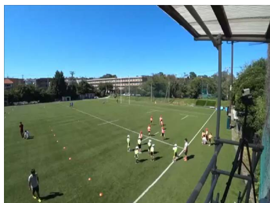
パス&キャッチのお手本映像