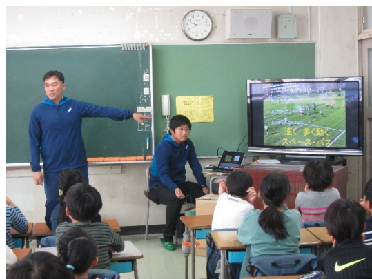
振り返り授業の様子