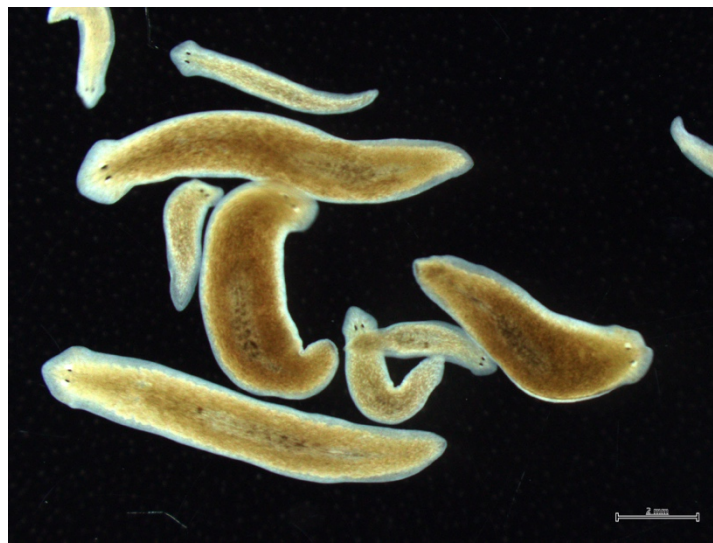
図 1. リュウキュウナミズムシの無性個体と有性個体。

本研究成果は、2019年4月16日に国際科学誌「Scientific Reports」に掲載されました。