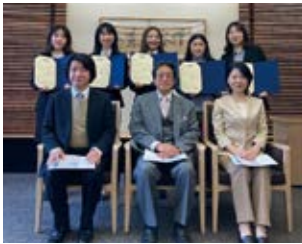
2022年度修了式 出席者のみ掲載

Those students who successfully complete two semesters of the GPP, having earned 8 credits from 4 different courses and another 8 credits from participation in two GPP workshops, will receive a certificate of completion from the President of Keio University and the Dean of the Faculty of Business and Commerce. Since it is possible to complete the program during the 3rd year of a student's college career, the certification will likely help in the job-hunting process. Additionally, since students will be recognized as participants in an honors program, it will likely be an advantage when applying to either a domestic or international graduate studies program. Students can start their program as best suits their individual career at Keio, beginning in the Spring of their 3rd year, the Fall of their 3rd year, or even the Spring of their 4th year. Students may choose to enroll in the GPP in non-consecutive semesters, thus allowing even greater flexibility.