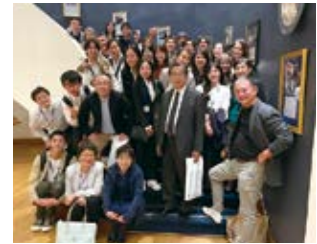
2023年度海外研修 with SF三田会メンバー