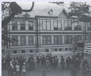
戦前の同窓会の様子

慶應義塾では在学を「塾生」、卒業生を「塾員」と呼んでいます。「三田会」は、福澤諭吉没後の1902(明治35)年に塾員相互の交流の場として発会して以来、国内外で次々に設立され、慶應義塾の大きな特色となっています。三田会の中でも居住地・勤務先のある地域で活動し、交流を深めているのが「地域三田会」です。ご自身のお住まいや勤務先の地域名を冠した三田会を探し、ぜひご参加ください。