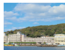
38 社会医療法人 青洲会 青洲会病院