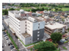
7 公益財団法人脳血管研究所 美原記念病院