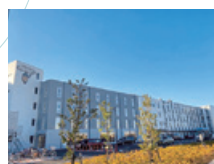
14 社会福祉法人仁生社 江戸川メディケア病院