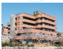
11 社会福祉法人太陽会 安房地域医療センター