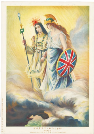
3. 「やまとひめとブリタニヤ」