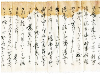
7. 板倉卓造宛北澤楽天書簡