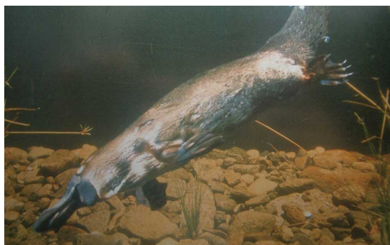
写真：カモノハシ (タロンガ動物園にて撮影)

4 C 型ナトリウム利尿ペプチド (CNP)：強力な利尿作用や血管拡張作用を示すペプチドホルモン的一种。心房性ナトリウム利尿ペプチド (ANP)、脳性ナトリウム利尿ペプチド (BNP) とともにナトリウム利尿ペプチドファミリーと総称される。ANP と BNP は主に心臓から分泌され、生体の血圧調節に関与する。一方 CNP は脳内に存在して神経ペプチドとして作用するほか、血管内皮やマクロファージからも分泌され、血管局所ホルモンとして作用する。ヒト CNP は 53 個のアミノ酸からなるが、カモノハシ CNP は 39 個のアミノ酸からなる (図 1)。