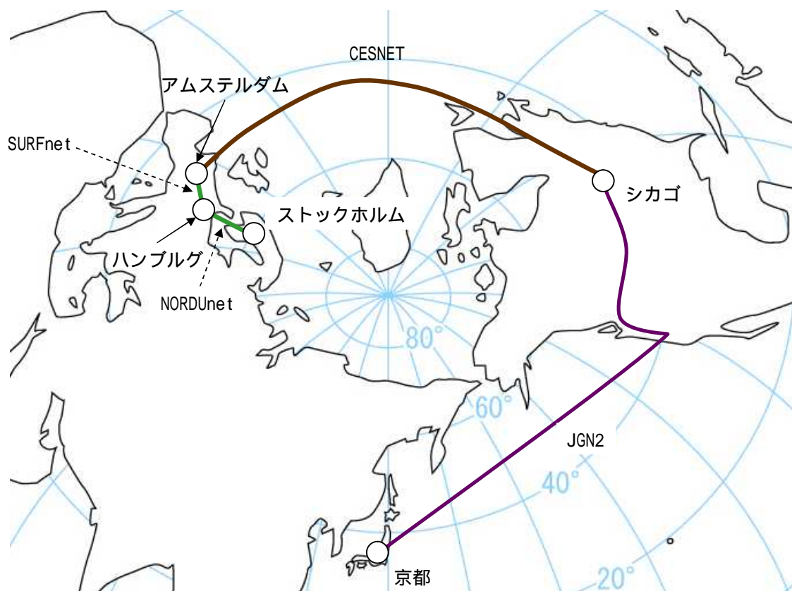
(図2) 4K 映像素材 (6Gbps) 2大洋横断 (21,000km) 中継配信実験の経路